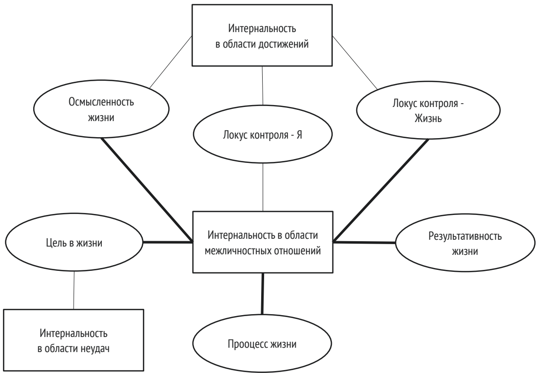
Рисунок 2 – Взаимосвязи локуса контроля со смысловыми ориентациями у студенток: