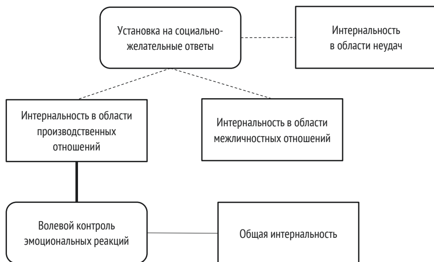
Рисунок 1 – Взаимосвязи шкал исследования у студенток: