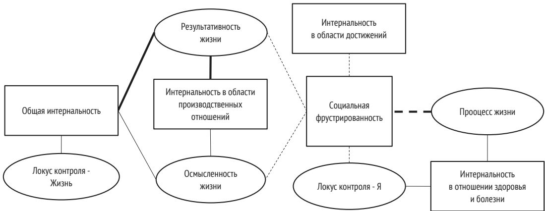
Рисунок 4 – Взаимосвязи социальной фрустрированности с локусом контроля и смысложизненными ориентациями у студентов мужского пола: